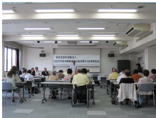
第43期通常総会の様子